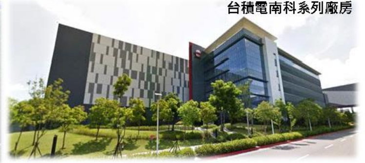
台積電南科系列廠房