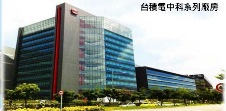
台積電中科系列廠房