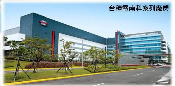
台積電南科系列廠房