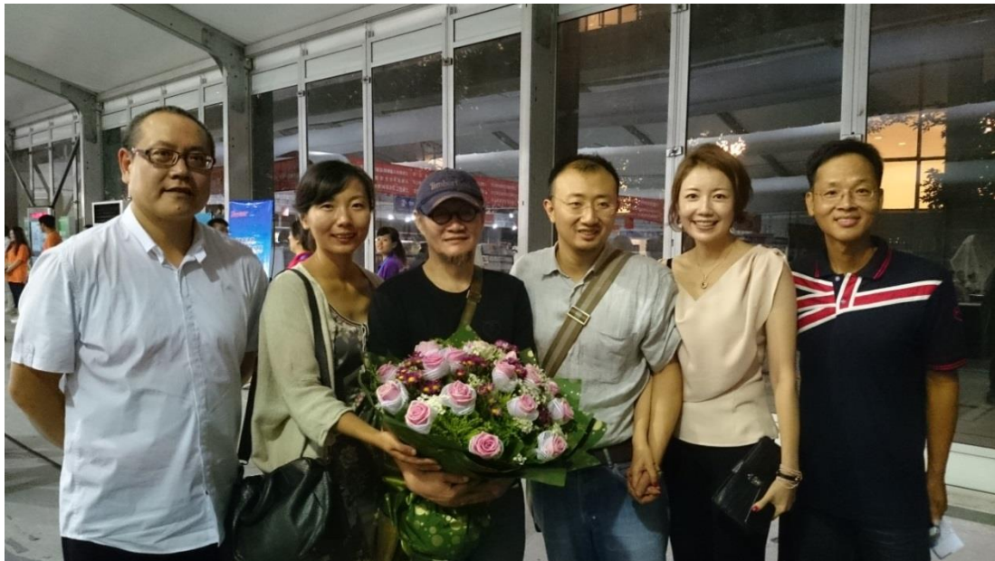
作者與分社長大合影