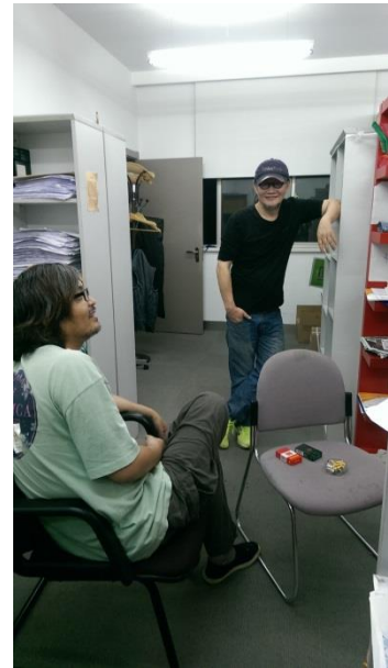
分社長與封面設計師