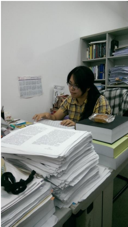
編輯與辦公桌上的稿件