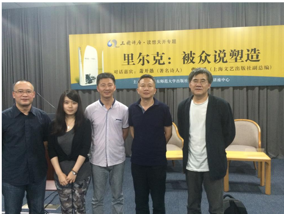
與出版社副總編、責任編輯和兩位詩人合影