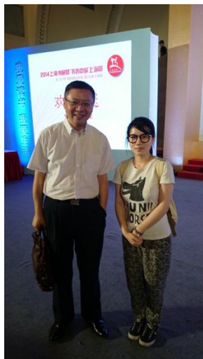
與學者 張維為合影