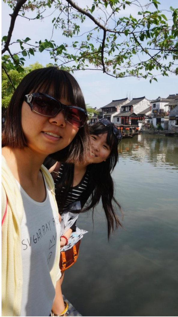
←浙江西塘，比蘇杭的水鄉更漂亮！還有煙雨長廊～