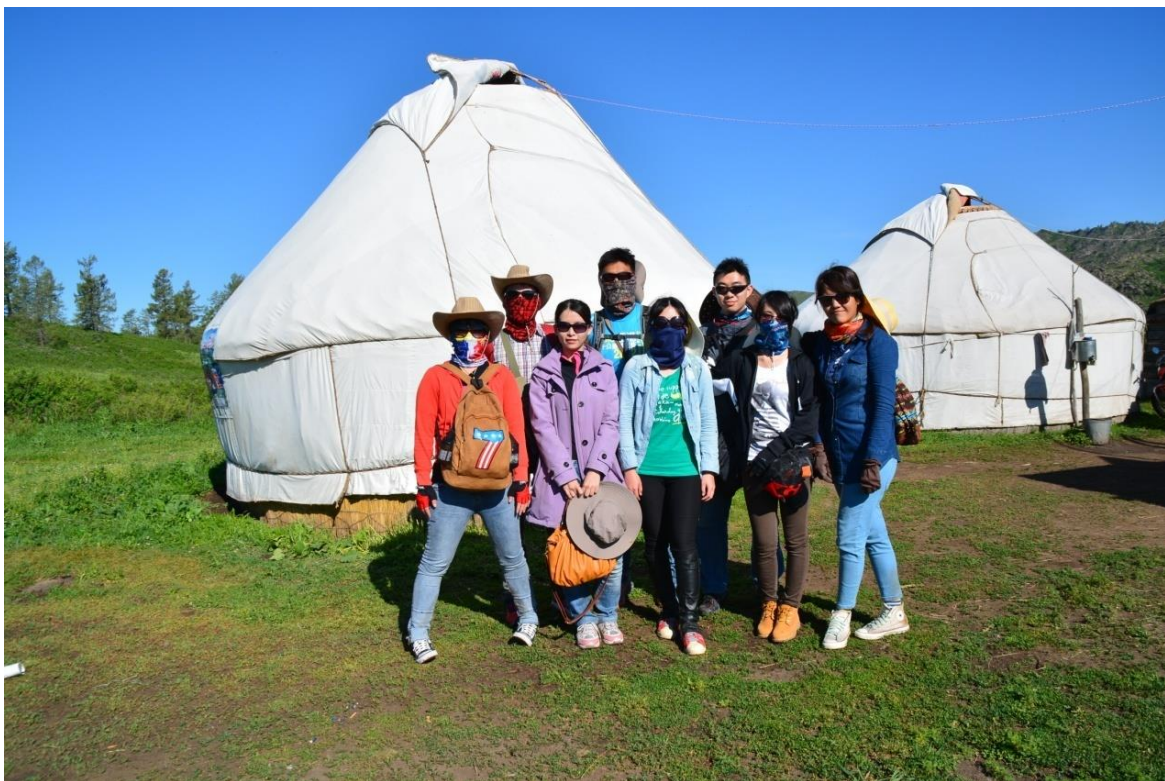
←北疆騎馬的隊員們。氈房耶！（我們就住右後方那間。）