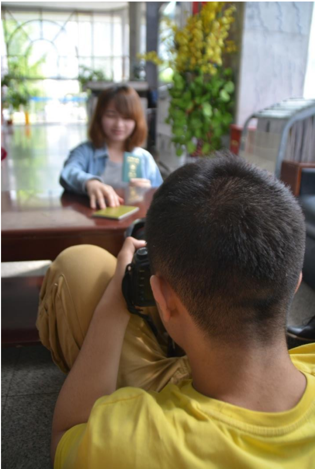
← 兩岸學生交流之一：真要拍「島國青年，捍衛民主」嗎？