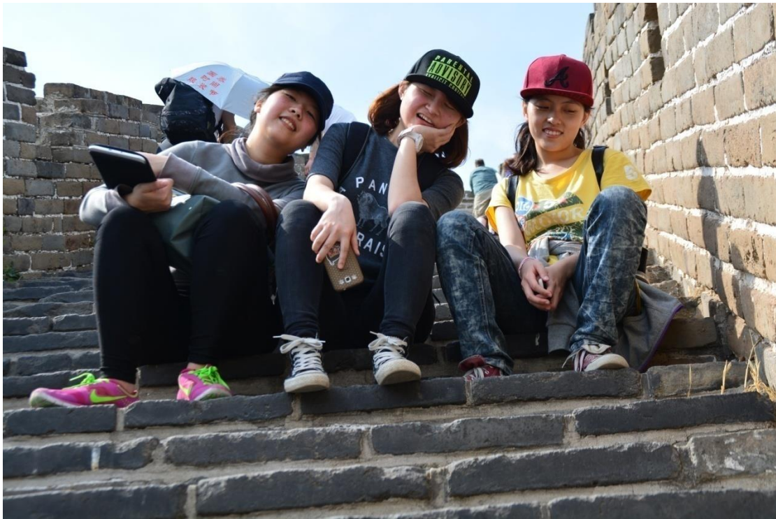
↑慕田峪長城之到底還要走多遠？QAQ”