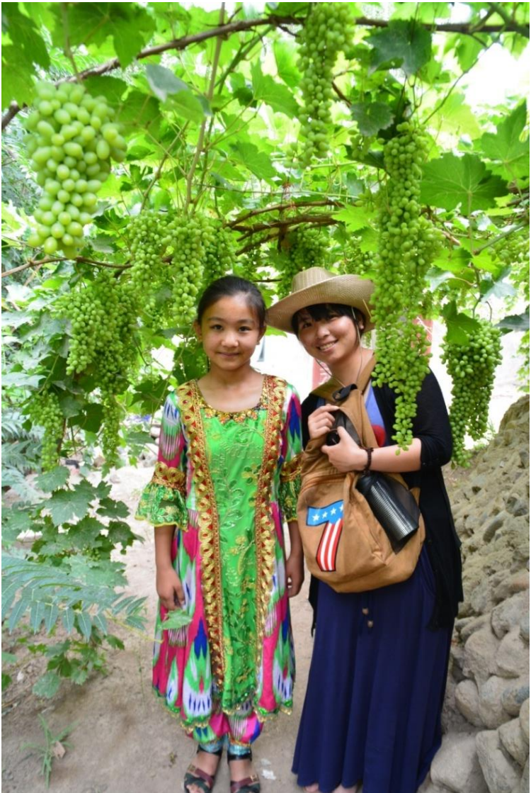
→ 可愛的維吾爾族少女，名字超長。