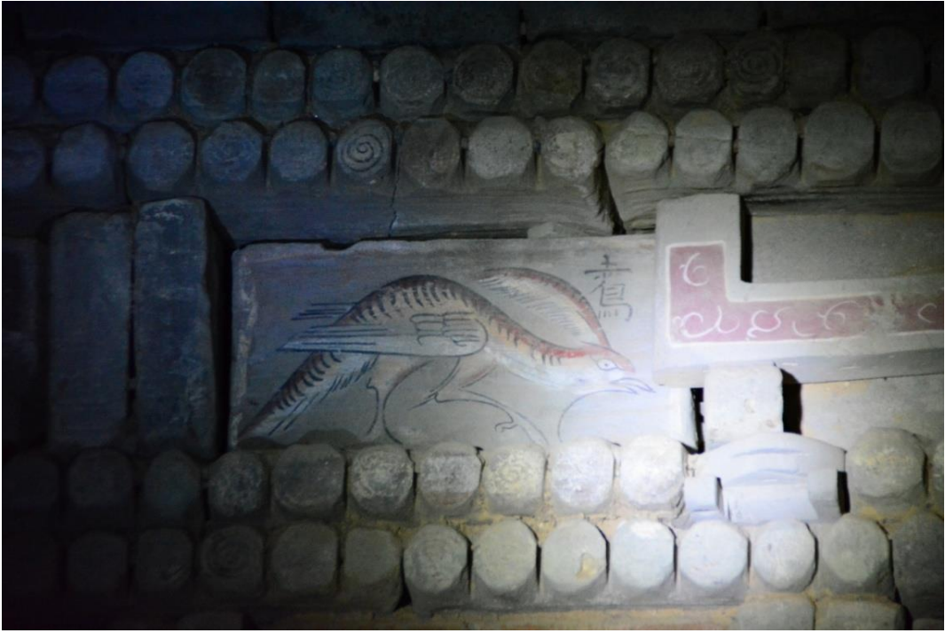
← 古代墳墓裡的磚畫，剛開鑿的時候色彩更美。