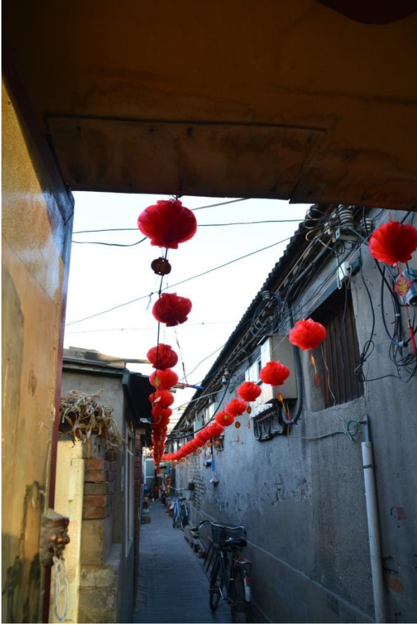
← 北京胡同，難得的老味道。