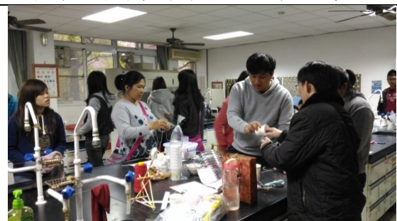
教師進行科學闖關活動-蛙鳴器之製備