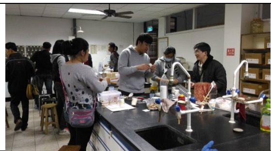
教師進行科學闖關活動-蛙鳴器之製備