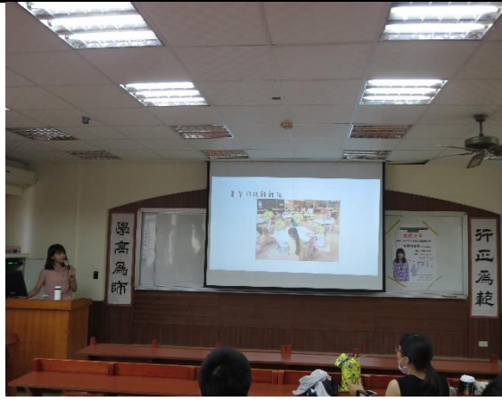
講師分享實習時的疑難雜症