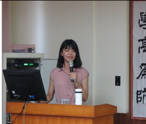
講者開場、自我介紹