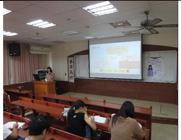
講者分享如何準備讀書計畫