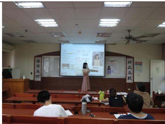
學生專注聽講，勤作筆記