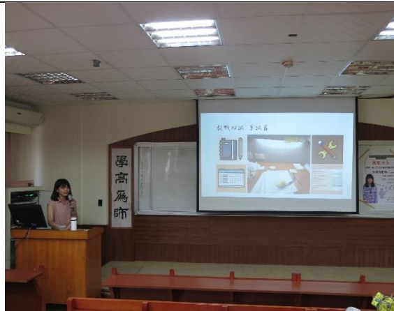
講者分享教甄筆試如何準備