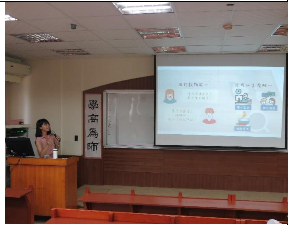
講者分享面對教甄時該如何準備