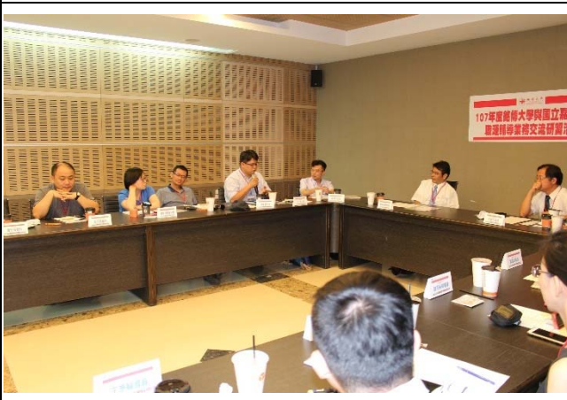
應數系林主任提問中