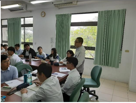
綜合交流座談時間