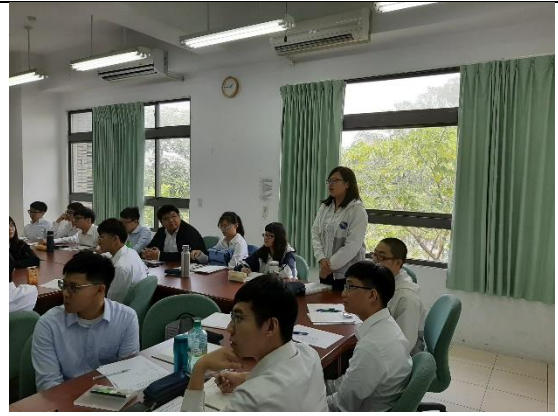
綜合交流座談時間