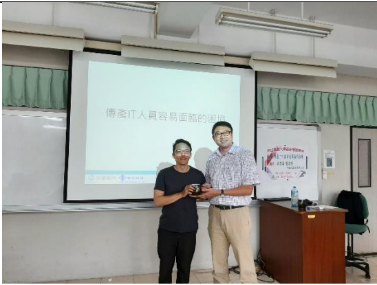
系主任頒發感謝紀念品