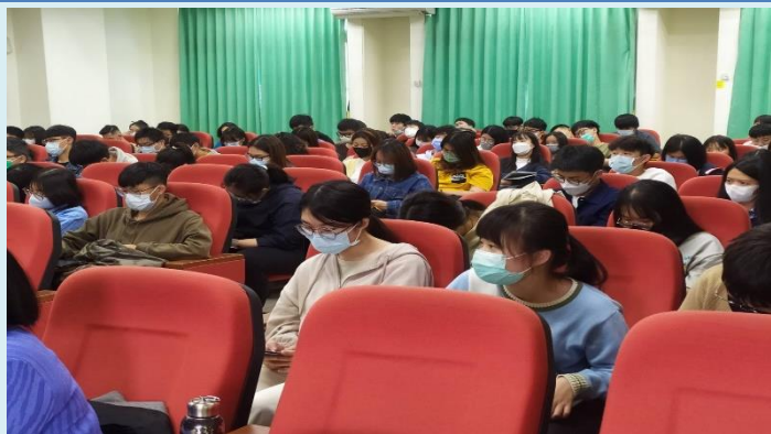
參與學生認真聽講