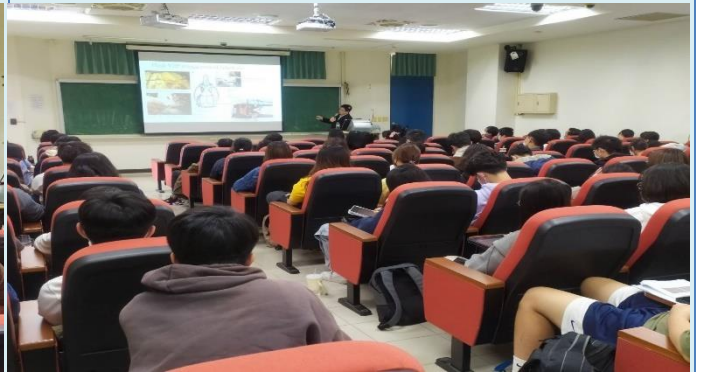
參與學生認真聽講