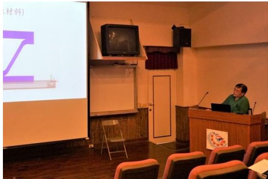
洪昇利教授演講畫面