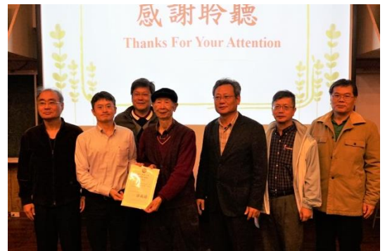
系主任頒發感謝狀