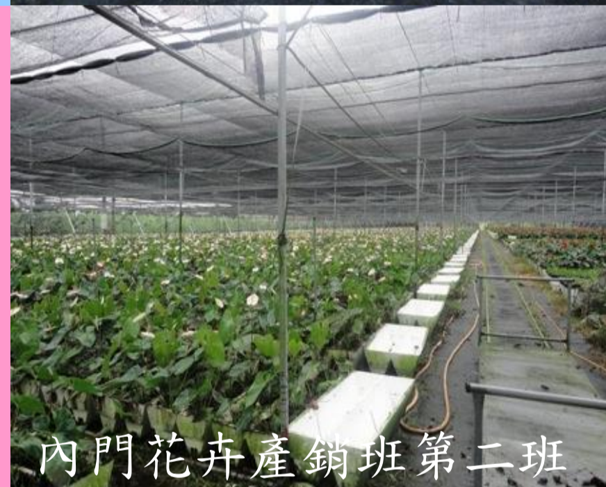
內門花卉產銷班第二班