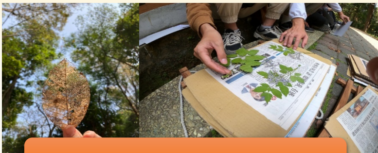
植物園巡禮暨植物標本、種子藝術創作