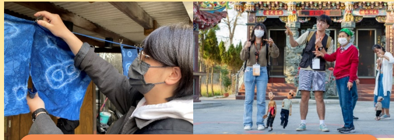
六腳與朴子：蒜糖及藍染的文化路徑 與社區力量 課程參訪與體驗實作

校長致力推動「 嘉義因嘉大而更繁榮、嘉大因嘉義而更永續 」的治校理念，透過嘉義地理特殊性，豐富生物及生態多樣性，培養本校學生具備通識素養並結合在地關懷，跳脫單向授課，藉由帶領學生走出戶外， 體驗跨文化素養、跨領域知識、跨經驗之課程 ，使學習過程多元化、深度化，並增進本校學生對於嘉義縣市人文、歷史、地理、生態等各面向之了解與認識。