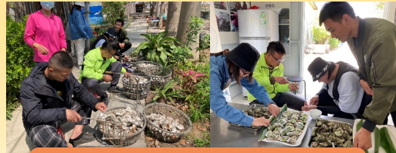
食農教育：從東石蚵出發 自己的午餐自己料理