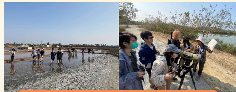
布袋鹽田人文及鳥類生態 課程體驗與操作

專屬【嘉義巡禮】FB粉絲專頁、Instagram(IG)積極宣傳課程及分享已開課之課程影片、照片紀錄。