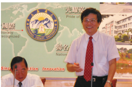
臺灣嘉義大學校友總會校友會館籌備會第2次會議母校邱義源校長(站立者)列席致詞

臺灣嘉義大學校友總會於101年10月6日（星期六）上午9時40分蘭潭校區行政大樓2樓第一會議室召開校友會館籌備會第2次會議，並於當日上午10時30分於行政大樓2樓第一會議室召開第七屆第六次理、監事會議，母校邱義源校長及李安進主任秘書列席參加。校友會館籌備會第2次會議討論會館位置及是否採用BOT模式興建或校友集資興建。第七屆第六次理、監事會議討論11月3日校慶校友大會餐細節及嘉大人第二期邀稿事宜。