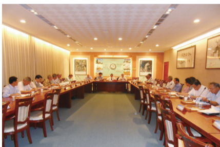
臺灣嘉義大學校友總會第七屆第六次理、監事會議在蘭潭校區行政大樓2樓第一會議室召開