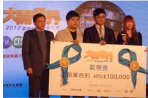
母校研發團隊領獎合照

「第二屆雲端頻道策展大賽-大開眼界」102年元月18日晚上於臺北舉行頒獎典禮，嘉義大學師範學院數位學習設計與管理學系和幼兒教育學系研究所學生團隊所規劃的5個優質雲端策展頻道，充分發揮創意和行動力，一舉勇奪三類大獎5個獎項，表現亮眼。