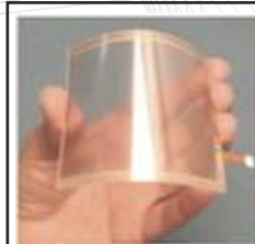
世界級化工新穎材料