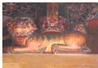
孔廟－大城殿三川門