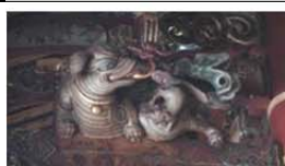
表 5 象座形態斗座圖像

大象，是陸地上體型最大，力量最大的動物，與「祥」字諧音，便有吉祥萬象和納福的寓意。當國勢昌隆時才會有南方使節進貢大象，借此祈求國家長治久安、物富民豐，太平有象的意思（康錫諾，2007）。