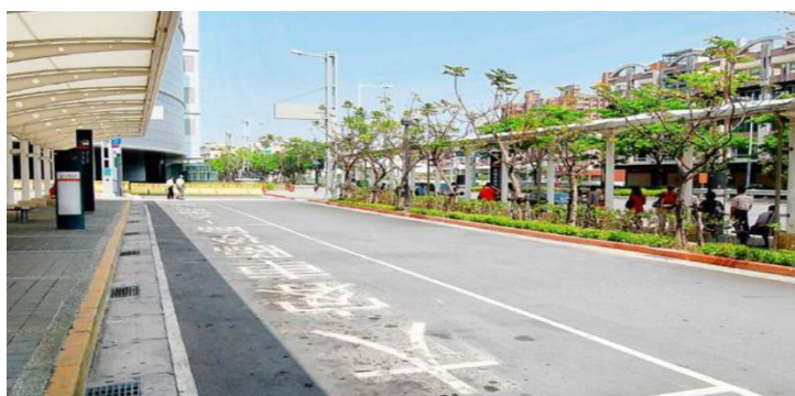
左營高鐵站大客車臨停處