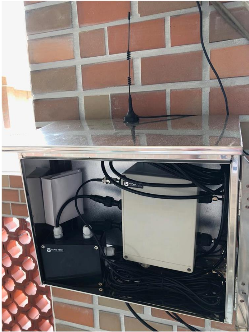
圖二、水質監測 IoT 系統