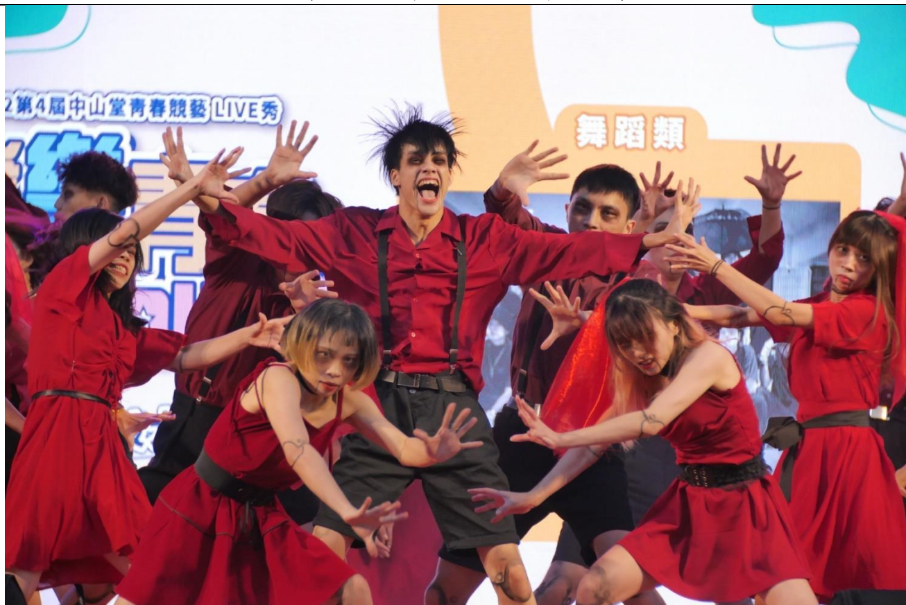
2022 第 4 屆舞蹈類演出及得獎同學