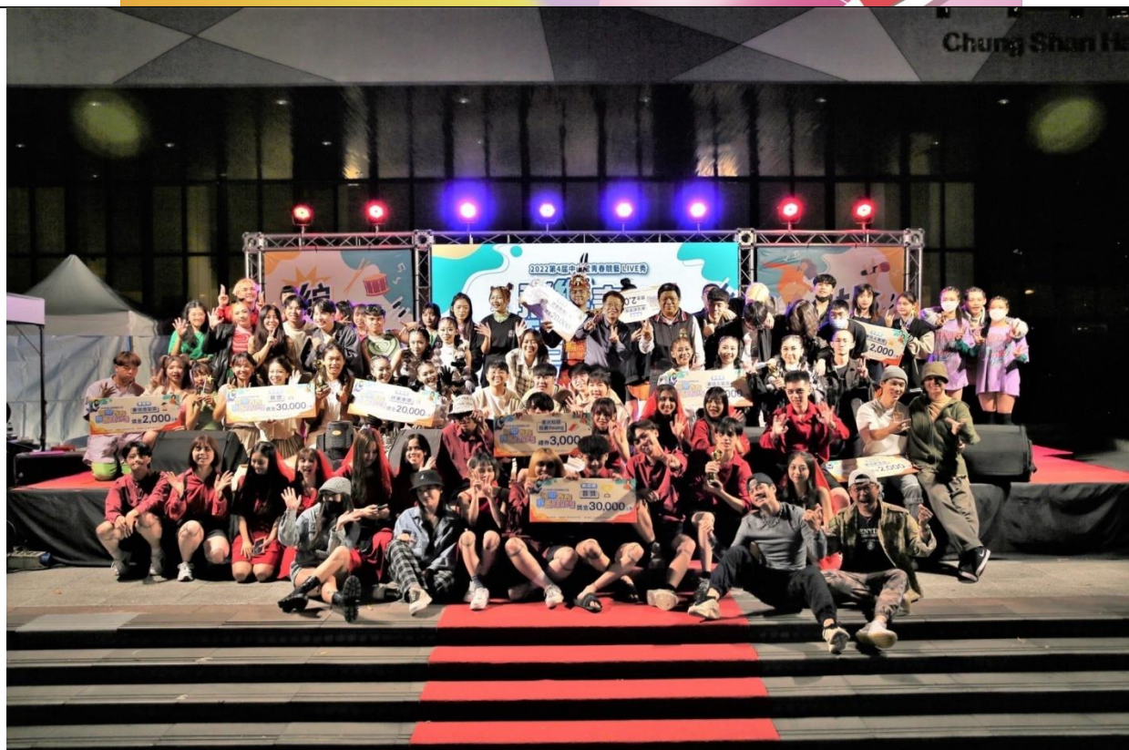
2022 第 4 屆決賽演出參賽同學大合照