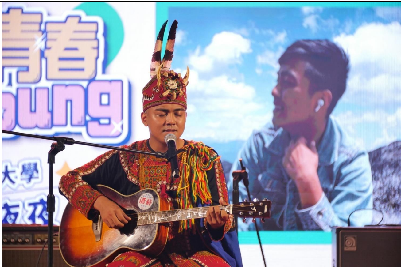
2022 第 4 屆音樂類演出及得獎同學