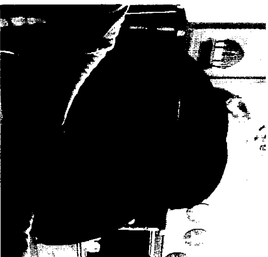
和我親密接觸的犀鳥